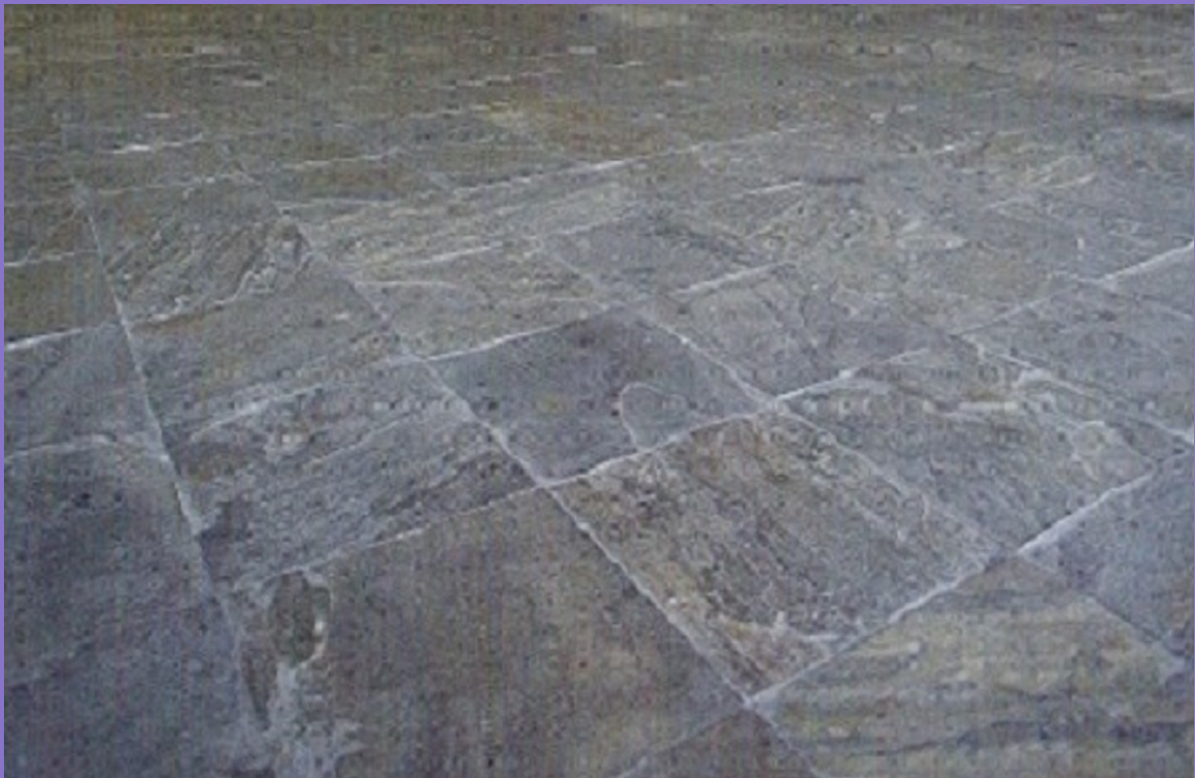
Pavimento con con Cuarcita elaborada Gris Draconte

PRECIO PALET: ,798,60* € IVA incluido. (660,00* € + IVA )