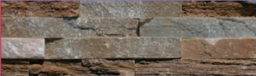
Premontado de Cuarzita Rústica Natural