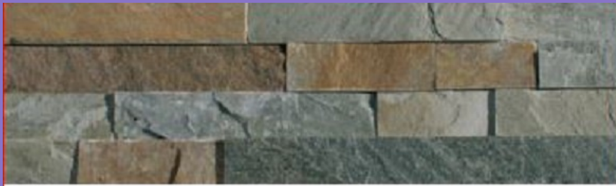
Premontado de Cuarzita Grisácea