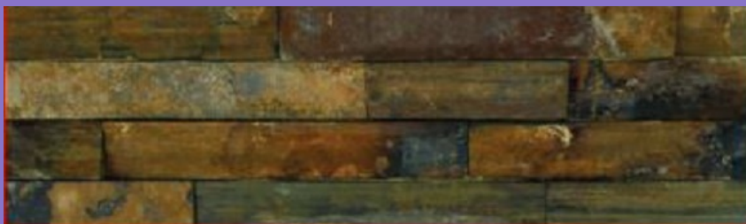
Premontado de Cuarzita Rústica Oxidada